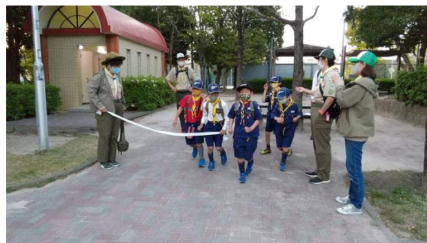
ゴールのテープカット