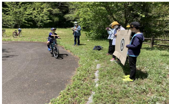
チェックポイントでのマト当て