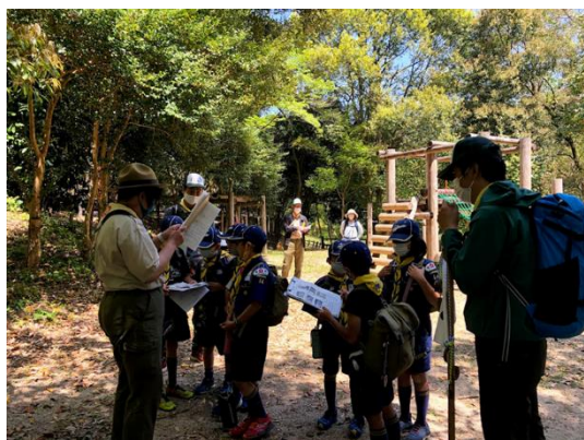
組対応、課題の答え合わせ

ゲーム「南蛮砦を制覇せよ」では遊具を使って競争してタイムを計りました。最後のジャングルジムではゴールの赤い布にタッチするのに全身を使って上り方を工夫していました。