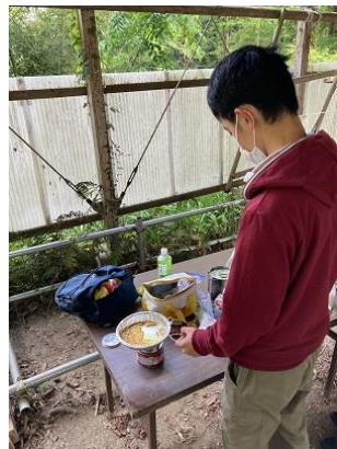
コロナ対策として、1人料理です