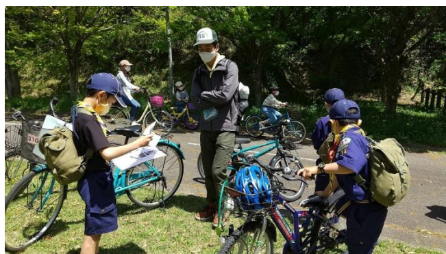
サイクリング出発

内容: サイクリング、活動目標: 好奇心と冒険心を満足させる。体の動きを高め、創造力を伸ばす