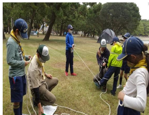
ロープワークです