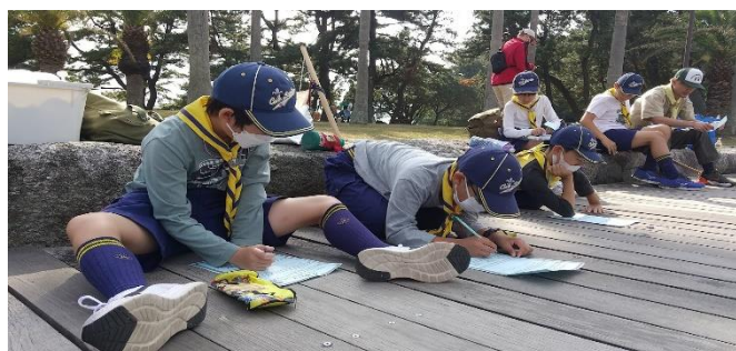
ゴミ拾いを振りかえりワークシートを書いています