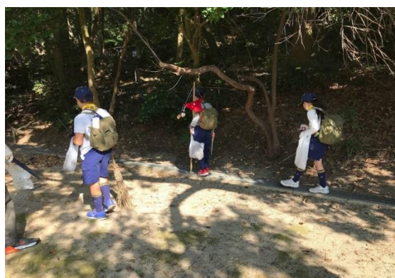
ゴミを収集しています