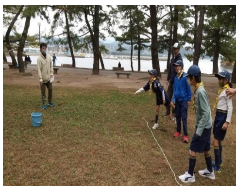
松ぼっくりを投げてバケツに入れるゲームは簡単なようでとても難しい！