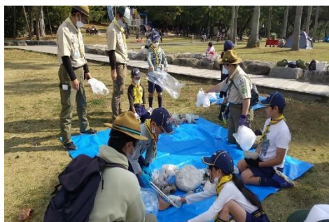
たくさんのプラスチックごみを拾いました